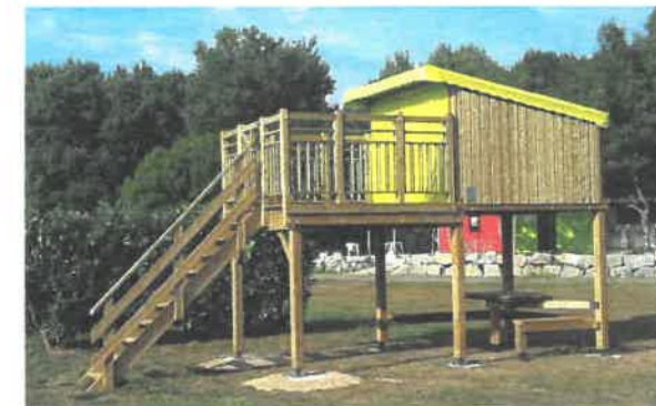
Cabane au camping de Beslé, pour les pèlerins !! (prise électrique dans chacune des deux cabanes).

Vous quitterez la Loire-Atlantique à Beslé-sur-Vilaine, pour la suite de votre chemin, vous trouverez les possibilités d'hébergements en Ile-et-Vilaine et en Manche sur le site de l'association bretonne des amis de Saint-Jacques : www.compostelle-bretagne.fr